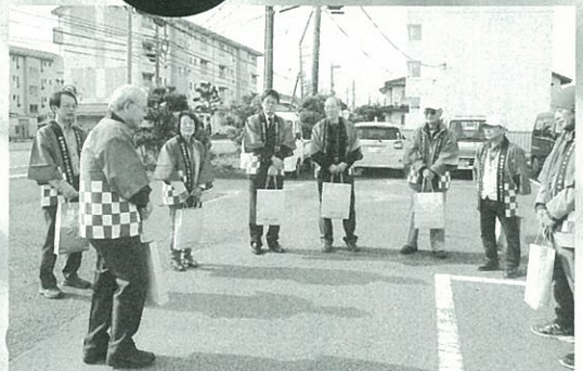
理事の皆さんと（竹内町浜の里）