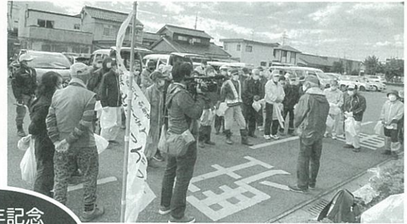
30周年記念 ボランティア除草 済生会病院