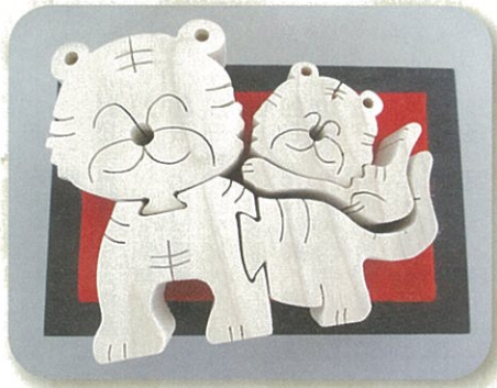
Kさん(竹内)木製パズル