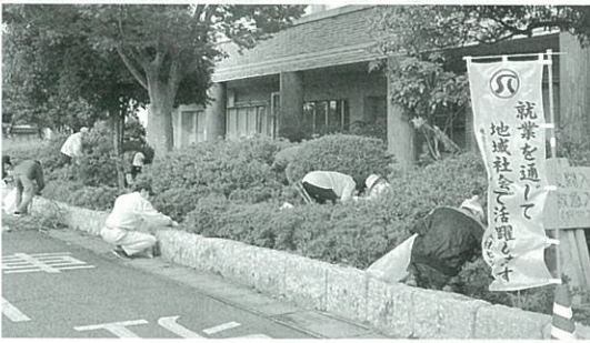
ご参加くださった会員の皆様、 ありがとうございました。