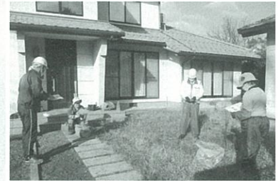
安全パトロール 除草作業