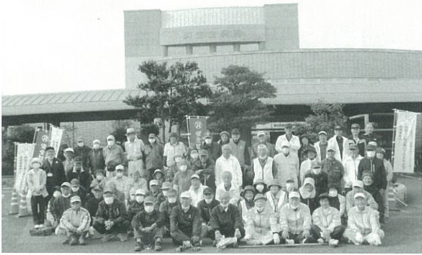
ボランティア除草 済生会病院 ことぶきクラブの皆さんと合同作業