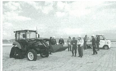
安全パトロール 海浜清掃