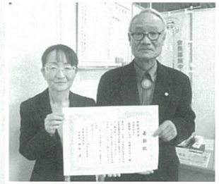
済生会病院より 表彰していただきました