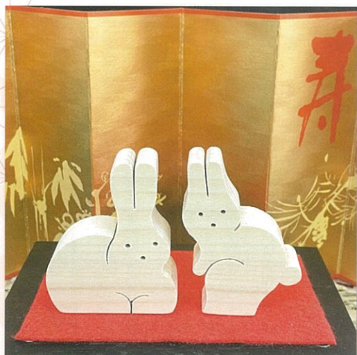
Kさん(竹内)木製干支の置物