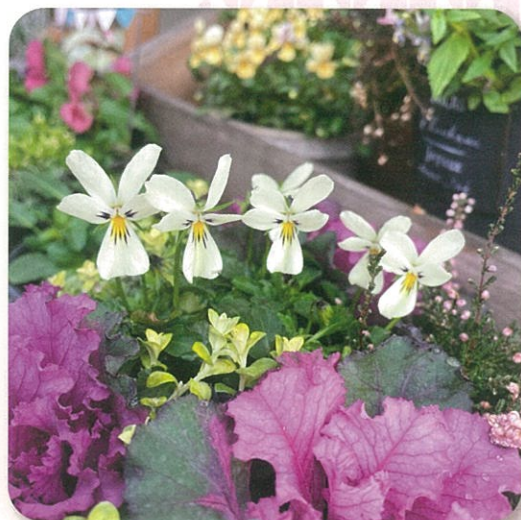
職員 うさぎ型ビオラ「至福のうさぎ」