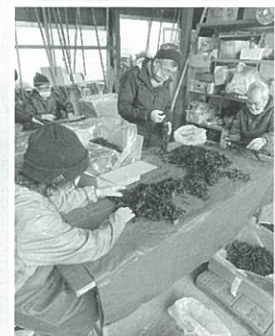
ワカメ茎抜き作業