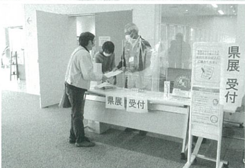
美術県展 受付・監視業務