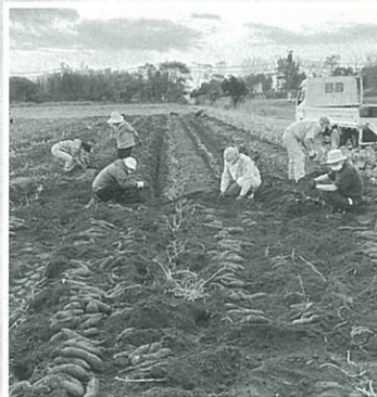
サツマイモ収穫作業