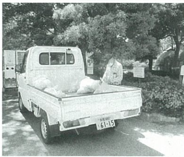
公園ゴミ回収業務