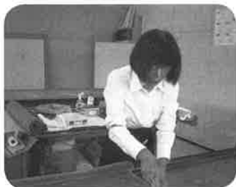
網戸張り替え中です

40年余りの会社勤めを終えて、「さて、これから何をどうすれば良いのか」と思案に暮れていた処、ある日新聞広告の折込みに、シニアワークプログラム地域事業の受講者募集が入っておりました。技能講習の年間予定表による講習内容が明記されていて、私は自分にも出来そうな気がして講習会に申し込み、受講する事が出来て、終了証や資格をいただきました。講習の中で介護研修を受講していたときは、介護認定レベル3の母が居て、徘徊、食事、トイレ、風呂、着替え等のことで悩んでいました。でも研修での介護に関する知識技術を学んだ事が家で即実践に結び付き、とても助かり、今では忘れられない思い出になりました。シニアだって若い頃がありました。いやいや、気持はずーっと若者です。このプログラムを大いに活用させていただき、これからの人生を楽しみたいと思っています。