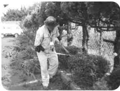
草刈りが大好きです

そのような中、当シルバーの生き残りを懸け、若手会員加入を図る一環として、入会説明会を随時開催するとともに、新規就業開拓として、市が取り組んでいる伯州綿栽培事業を平成26年度から、シルバー事業の企画提案方式事業として補助適用されるよう市とも連携しながら進めてまいりたいと考えております。会員の高齢化と減少が進む中、当シルバーが地域社会から信用と信頼を得ることも大切