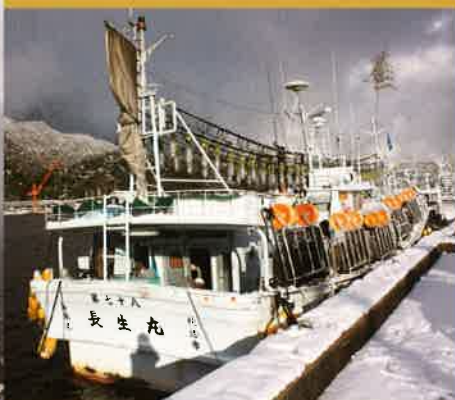
船名に惹かれました。