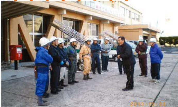
毎年恒例の、剪定班による市役所前庭剪定ボランティアをH25年12月23日に開催しました。寒い中、大変お疲れ様でした。ありがとうございました。