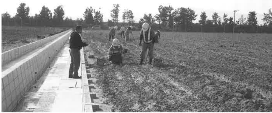
中浜干拓地 石拾い