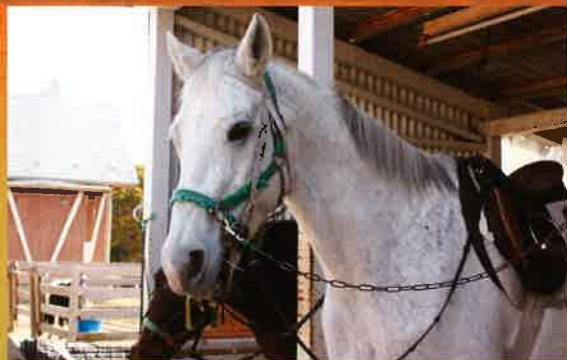
今年は午年 駆る!! ~大山乗馬センターにて~