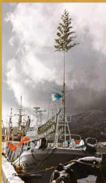
鳥根県側から境港を望む