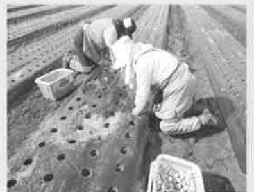
ニンニクの植え付け