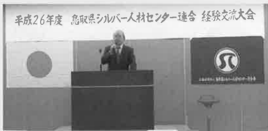
鳥取県シルバー人材センター連合 経験交流大会にて