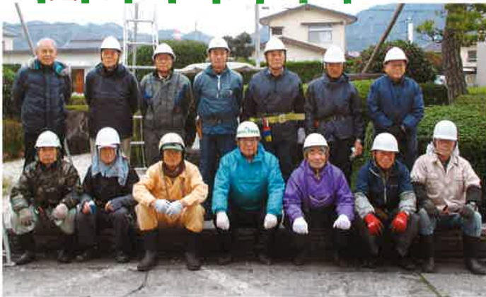
毎年恒例の、剪定班による市役所前庭剪定ボランティアをH26年12月23日に開催しました。寒い中、大変お疲れ様でした。ありがとうございました。