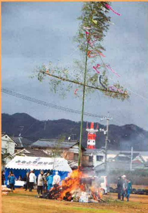
無病息災を祈って