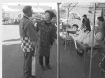
普及啓発活動（JA祭り）