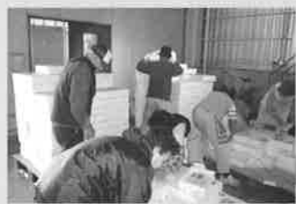
門永水産出荷作業