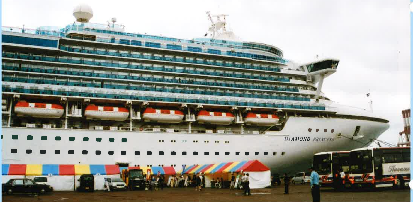
「ダイヤモンド・プリンセス」(イギリス船籍、11万6千トン)