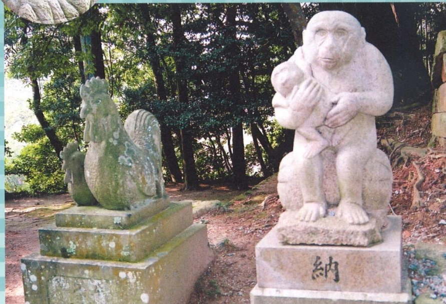
松江市 許曾志神社