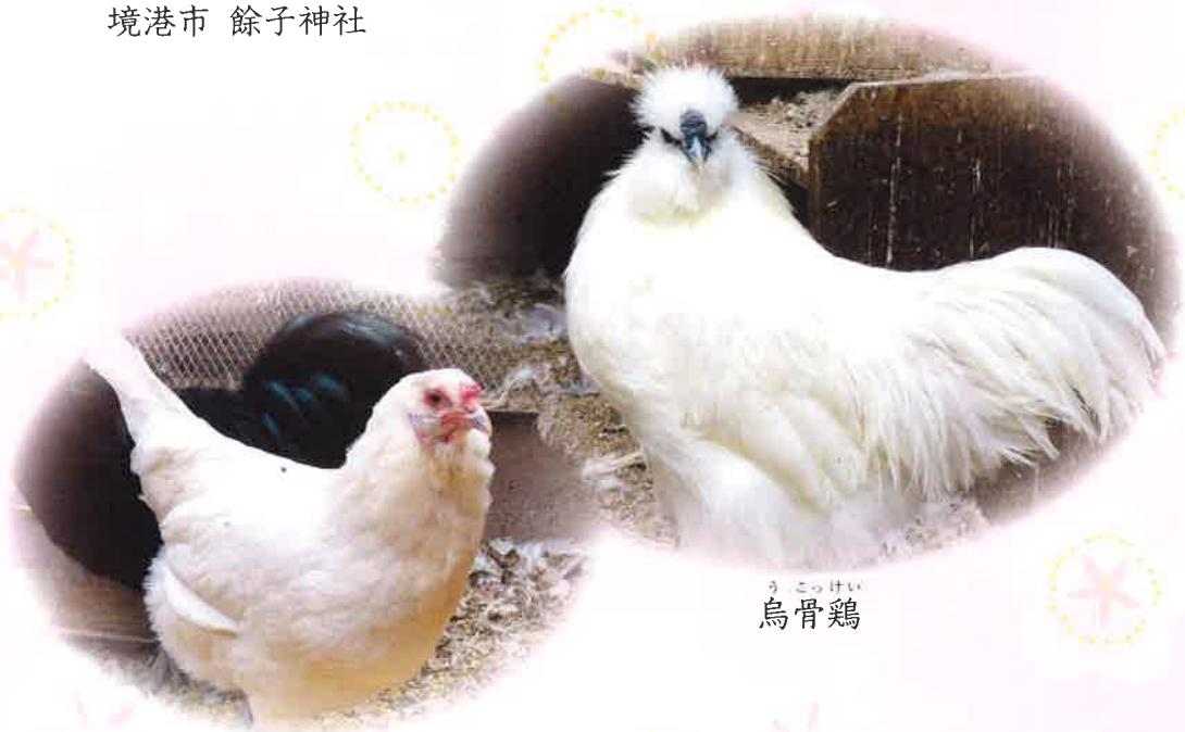
うごっけい 烏骨鶏