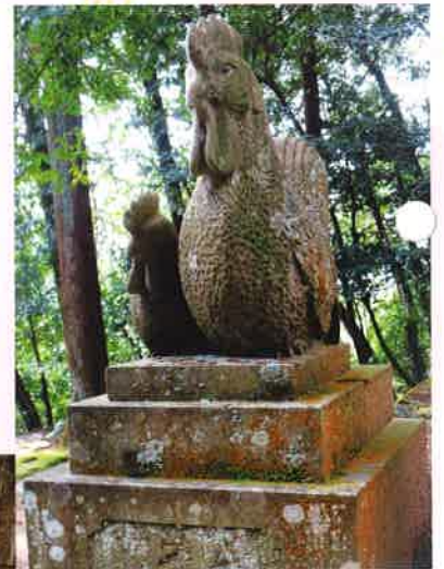
松江市 こさし 許曾志神社