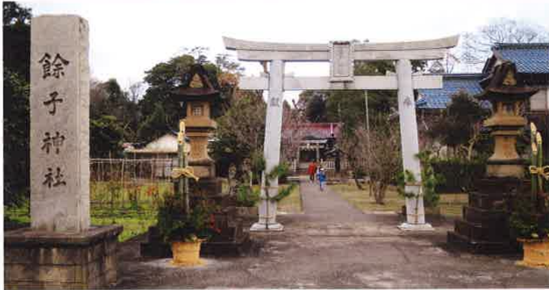
境港市 あまrico 餘子神社

編集発行/境港市シルバー人材センター 〒684-0034 境港市昭和町11-22 ☎(0859) 47-4540 FAX(0859) 47-4541 印刷/磯カワバタ印刷