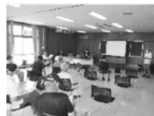
熱中症予防講習会