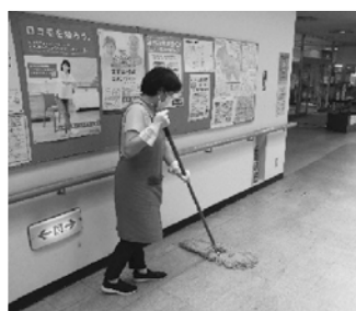
公共施設等清掃業務