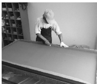
襖・障子・網戸の張替え