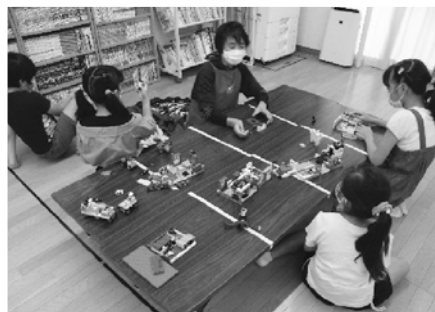
児童クラブ支援員補助