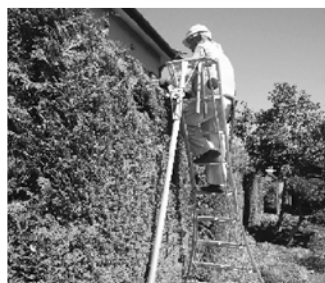
植木の剪定・刈込・伐採