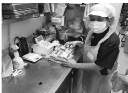
コンビニの厨房調理