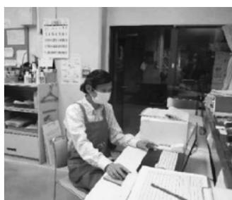
公民館の管理・受付