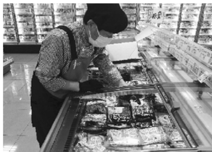
スーパーの品出し