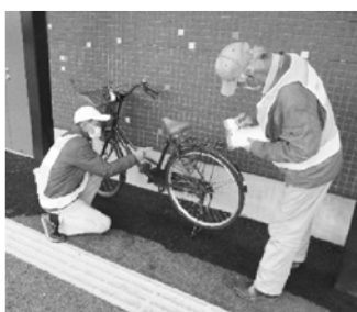
駅前放置自転車管理