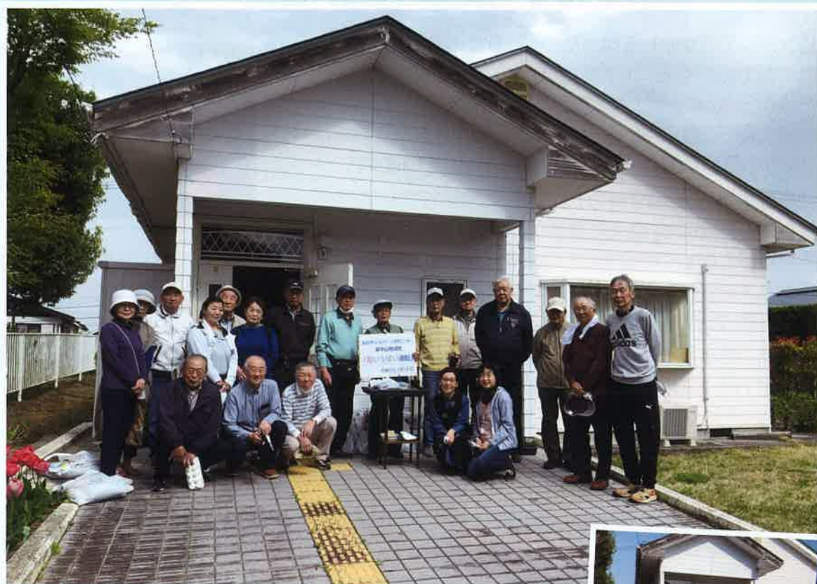
▲ボランティア活動で植付けた満開のチューリップの前で

泉中山地域班では、コロナ禍であっても3密を回避できる班活動として、3年前から「花いっぱい運動」を行ってきました。今年も去る4月14日に仙台市南中山老人憩いの家で開催したところ、28名の参加がありました。