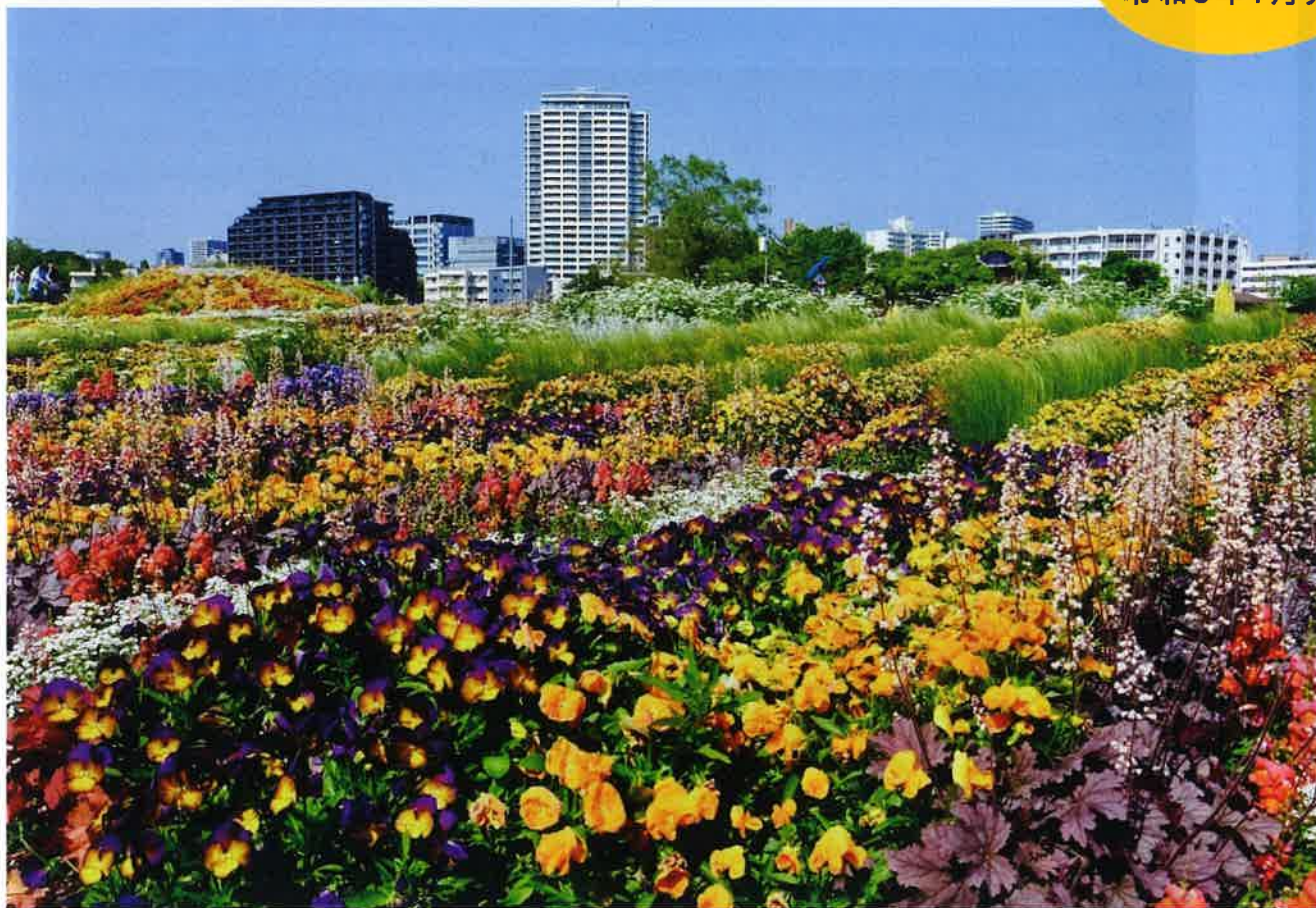
第40回 全国都市緑化仙台フェアが開催された青葉山公園追廻地区 ※令和5年4月26日(水)～6月18日(日)に開催されました。