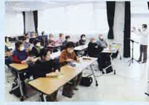
▲カラオケレッスンの様子