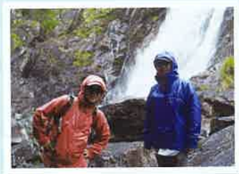
▲大川(オオコ)の滝にて

レンタカーを置いて、新緑の森に分け入ると、手つかずの自然が目の中に飛び込んで来て、視界が緑に吸い込まれるような、変な感じになります。その一つ、島の北東部を流れる白谷川の上流に位置する自然休養林で、苔むす森と、太鼓岩は『もののけ姫』の舞台のモデルとしても有名です。今回も、懐かしの自然、風景にひたって、ぶらり旅を満喫出来ました。帰りの朝、宿で顔見知りのスタッフさんにご挨拶し、空港に向かい帰路につきました。