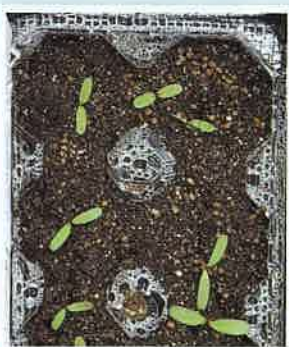
◀卵容器を利用して 芽を出したマリーゴールド