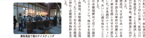
葡萄醸造で酒のテイスト

旅行日程の11月10日、参加者7名が旅行バスで香川県へ乗り、新型コロナウイルス対策の観点から、事前予約の現地見学、酒造りに向けての出発となりました。 酒造りに向けての出発となりました。酒造りに向けての出発となりました。