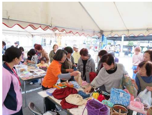
(令和元年 10 月 26 日のシルバーフェスティバル「新鮮野菜販売」左・「小物バザー」右)