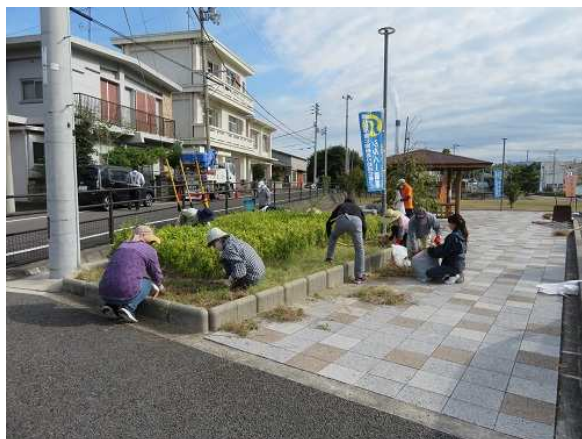
昨年の「三島 港記念公園周辺」奉仕作業