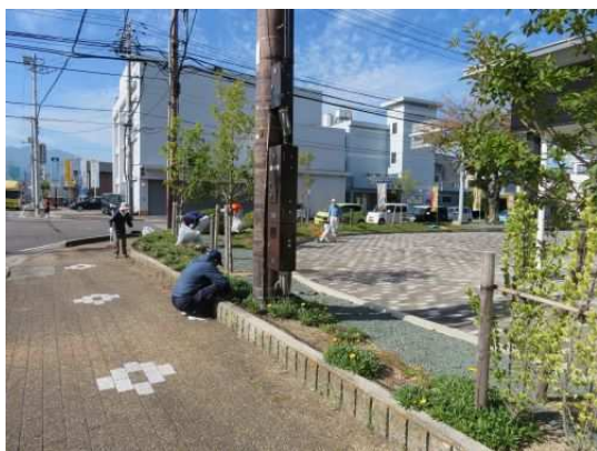
昨年の「文化センター周辺」奉仕作業