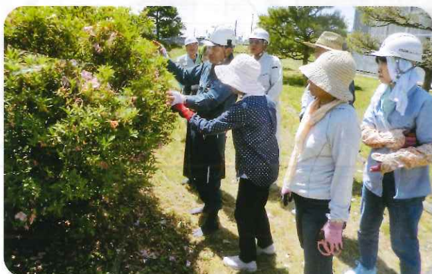
受注能力や技術の向上のため剪定や雪囲いをはじめとして講習会を開催