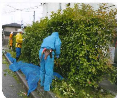
奉仕作業で生垣の手入れを実施