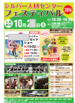
2016年のポスターです