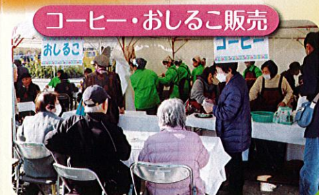
コーヒー・おしるこ販売