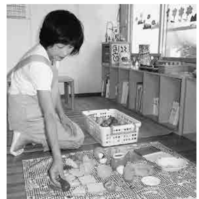
玩具は、週1回消毒しています。

就業中の万一に備え、全会員が傷害保険と賠償責任保険に加入しています。補償内容は、定時総会議案書60頁をご覧ください。