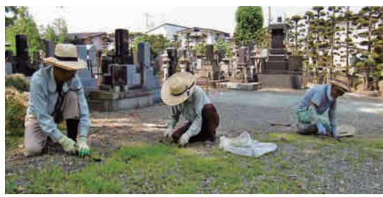
草取りできる方の入会をお待ちしています。