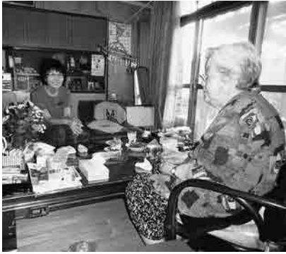
掃除を終え、ご依頼主の話を耳を傾けます。