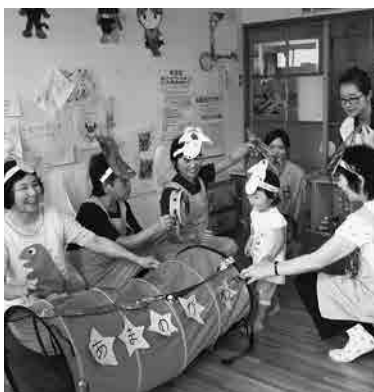
7月5日(土)七夕おたのしみ会

利用対象 就学前の幼児とその家族 利用時間 日・祝を除く毎日 午前10時～午後5時 (休館日は、お問合わせください) 利用料金 1人1か月 100円