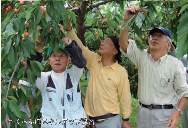
さくらんぼスキルアップ講習