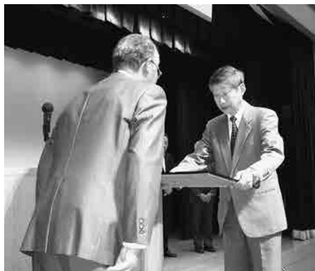
退任された役員に表彰状

定例の報告事項に続き、平成25年度の決算を承認し、任期満了に伴う役員改選を行い新役員を選任しました。