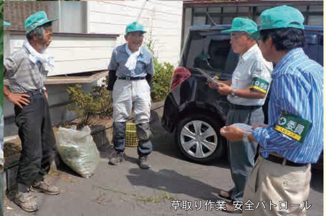
草取り作業 安全パトロール