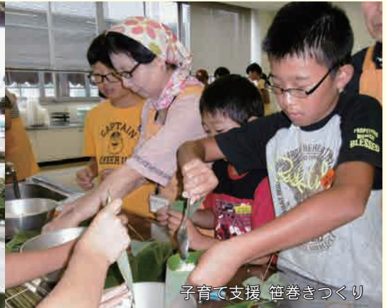
子育て支援 笹巻きづくり