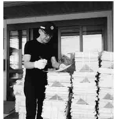
順序良く、囑託員さんへ配達。

長さんへ市報等を配達するのが仕事です。他に、計量器事前調査、物産展の搬入搬出の仕事をやりました。