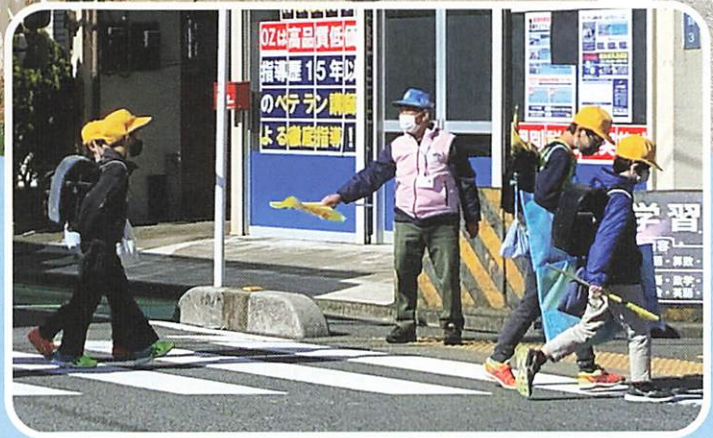
美笹地域班児童見守り活動