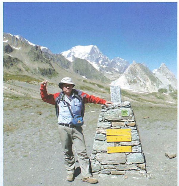
フランス、イタリアの国境にある山の稜線