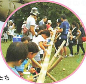
流しそうめんに歓声をあげる子どもたち

2017年にはボランティア団体「戸田MKJ(妙顕寺)の会」を立ち上げ、催しの開催やお祭りへの出店、竹炭作りなども実施しています。環境問題を多くの方々に考えていただければとおっしゃっていました。