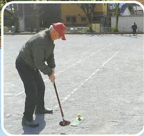
シルバーグラウンド・ゴルフ同好会