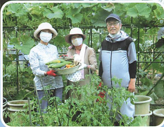
ワイワイ菜園サークル