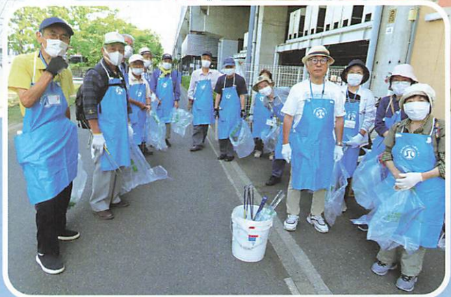
新曽地域班 地域美化活動