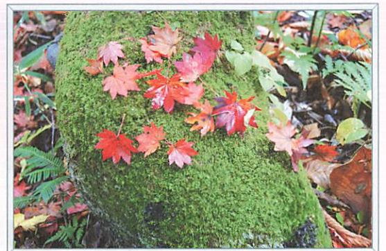
【写真】 高橋良次さん「雨上がりの朝」 (群馬県水源の森にて/297×420mm)