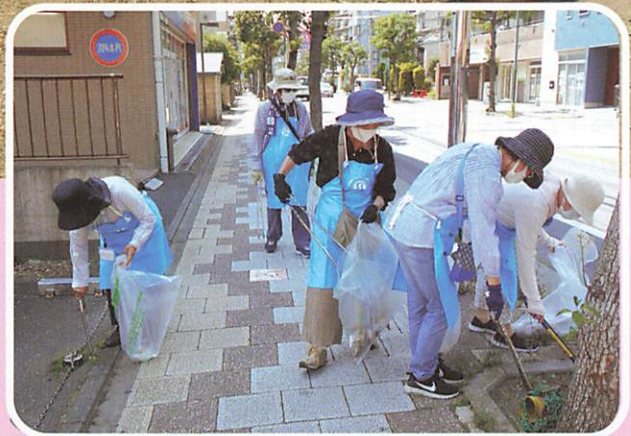
下戸田地域班 地域美化活動