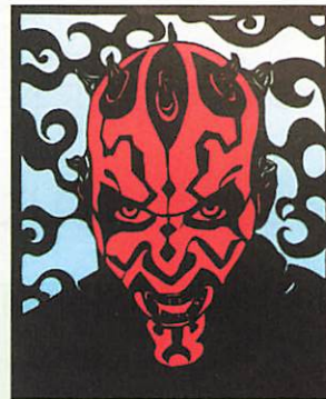
①スター・ウォーズ「ダース・モール」

く、グリーティングカードをヒントに試行錯誤しながら立体切り絵にも取り組んでいるそうです。次はどんな作品を作ろうかとあれこれ考えている時間が一番楽しいとのこと。立体の作品③を平面の写真ではうまくお見せできないのが残念です。