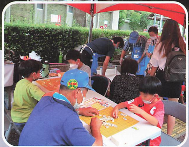
戸田ふるさと祭りブース出店