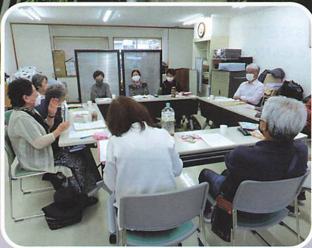
ブック&ムービーサークル「本の紹介」