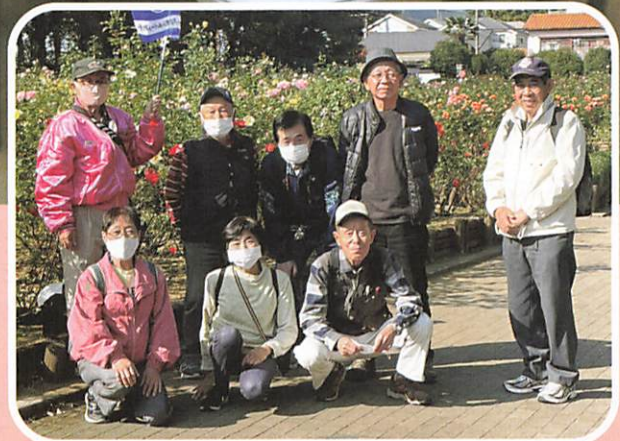
美笹地域班「ばら見学会」