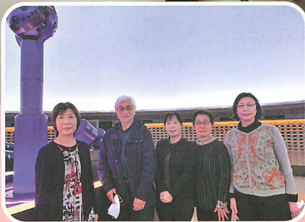
星空の会「府中市郷土の森博物館」にて