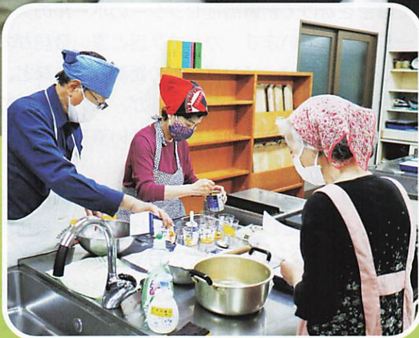
かんたんお菓子作りサークル ♪おいしくなあれ♪