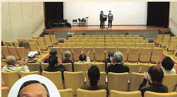
新曽福祉センターのホールにて