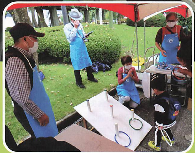
戸田市商工祭シルバーブース