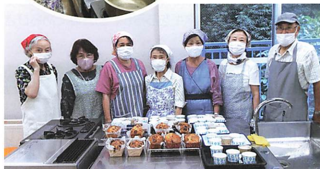
バナナケーキと杏仁豆腐の完成♪