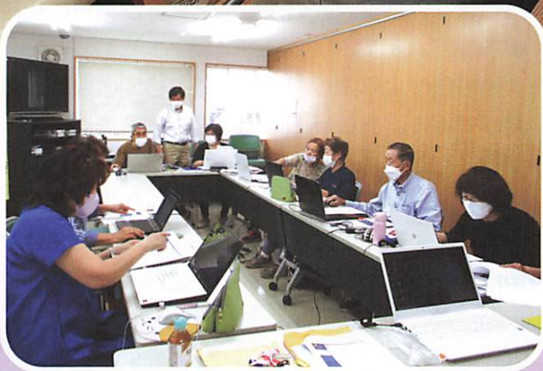
シルバー・パソコン同好会