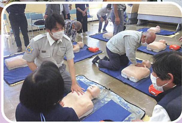
新曽・美笹地域班合同「救命救急講習会」