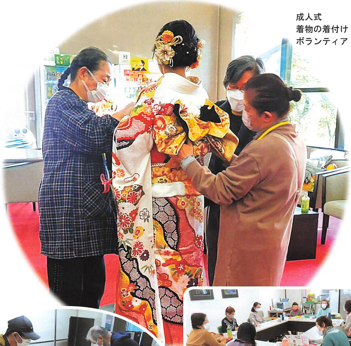
成人式 着物の着付け ボランティア