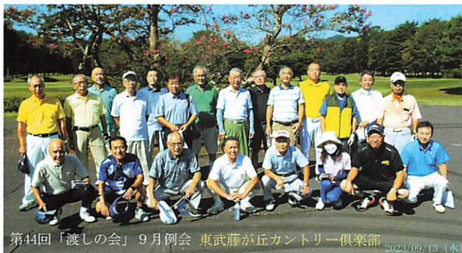
第44回「渡しの会」9月例会 東武藤が丘カントリー倶楽部 2023/09/13 (水)