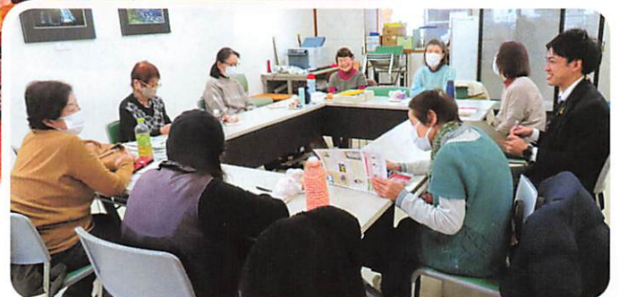
サークル「たんぽぽ」