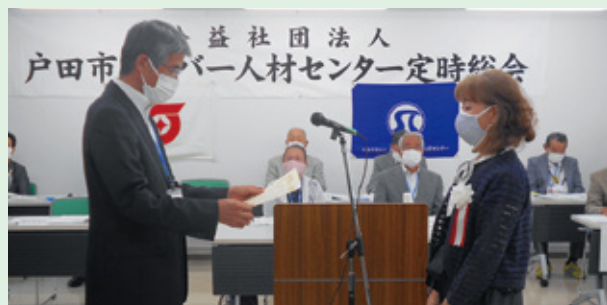
10年在籍会員を表彰しました

また、定時総会開始前に広報委員会が作成したセンター活動紹介ムービーを上映いたしました。この動画は当センターホームページ視聴できますのでぜひご覧ください。