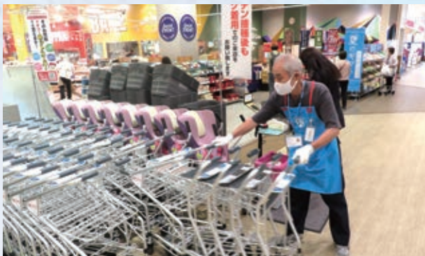
忙しくても安全第一で作業しています。

1日の仕事を終えた夜の晩酌が美味しく、仕事をしていることで健康に過ごせています」。