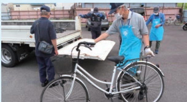
自転車は丁寧に扱います。

なおトラックでの搬入や引取時間も決まっていないので、重なった時には2人で協力して作業を行っています。その他、保管所内の草取りや掃除もできるだけ行い、ご近所に迷惑が掛からないように気をつけています」。