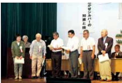
会員表彰者・役員表彰者