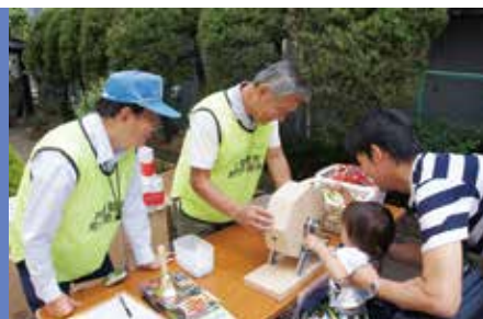
就業として抽選会場の運営もしています