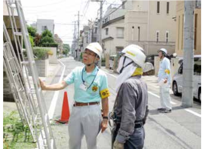
梯子の掛け方について現場の会員と話し合う