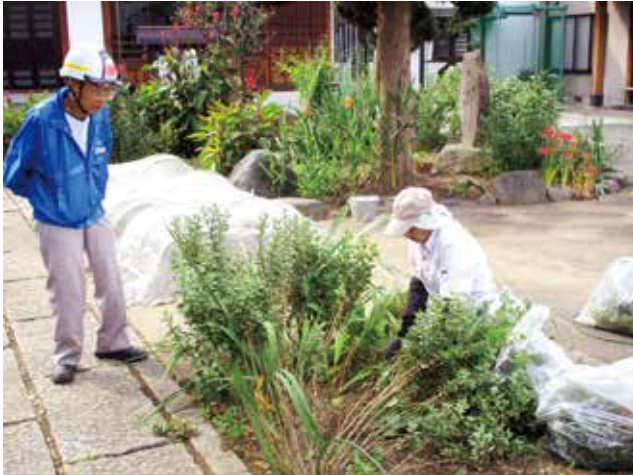
各現場を巡回し、安全について聞き取りをする