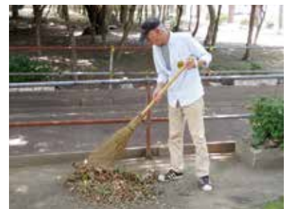
「ゴミがたくさん集まりました」