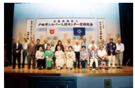
カラオケ大会参加者