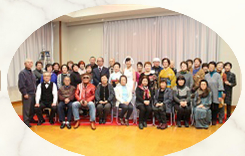
<第1回「ツバコレ」ファッションショーの様子>