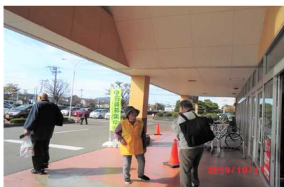
原信吉田店 10月17日(木)