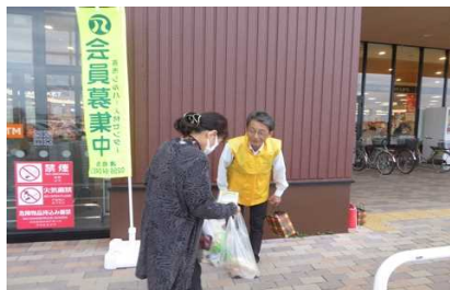
マルイ分水店 10月15日(火)

今回は各スーパーのシルバーデーに、店頭前(出入口)に立って、入会案内等を午前中配布しました。