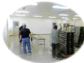
イベント会場設営