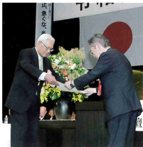
全国のシルバー人材センター（1,325団体）の中から、優秀賞に4団体、優良賞に18団体が選ばれました。

燕市シルバー人材センター事務所脇（燕勤労者総合福祉サービスセンター内）に設置しておりますので、利用者・会員の皆さまもぜひご利用ください。