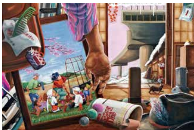
絵画「手」 第7地区 齋藤 隆