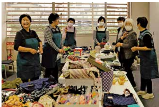
創作品展示頒布会（女性部会）