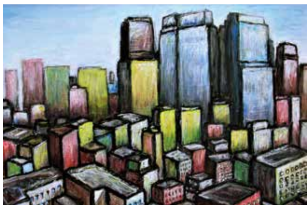
絵画 帝国ホテルより臨む 東沢地区 江口 誠一