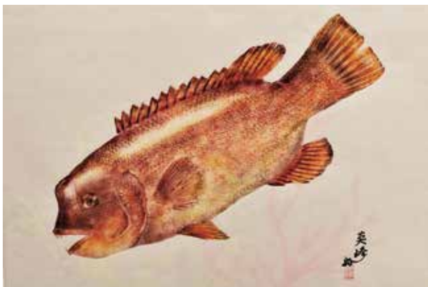
色彩魚拓 カンダイ 蔵王地区 古澤 英雄