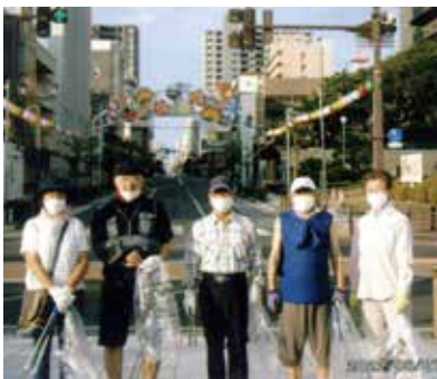
会員による清掃活動

また、国分寺薬師寺の「植木市まつり」では、最終日の翌朝(十一日)六時から第三・第四・第五・第八・第九・鈴川地区の合同で会員二十名による清掃活動も行われています。薬師寺、臨時駐車場(馬見ヶ崎河川敷)周辺を二班に分けゴミ収集活動に協力し、地域貢献にこれからも継続して活動してまいります。参加会員の高齢化も進み若手会員の参加者を募っています。