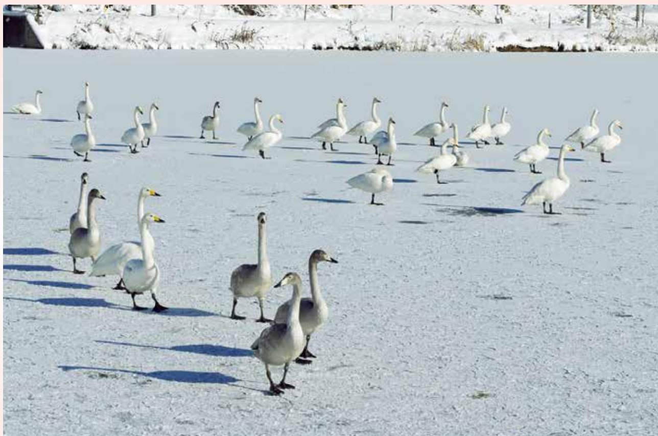
「白鳥渡来」山形市隔間場 大沼

第149号 令和5年1月1日発行 (公社)山形市シルバー人材センター 正会員数1,276名 賛助会員 33個人・65団体(11月末現在)