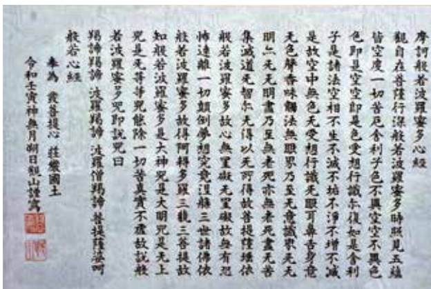
書 般若心經 西地区 細谷 孝司