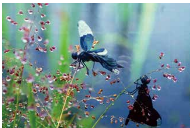
写真 雨の日に憩う 賛助会員 和田 勝子