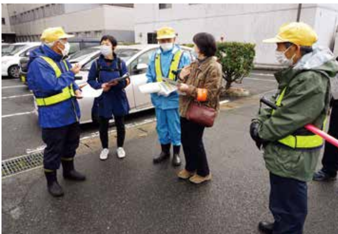
済生病院 駐車場整理業務

パトロールの結果、重大な危険項目はなく、しっかりと安全を確保し、その場所を利用する一般市民の安全も考慮しながら高いスキルをもって就業しております。若干、緊急連絡カードの不携帯があり、就業の際は正しく身に着けて携帯