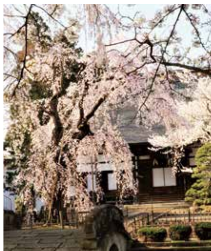
光禅寺のしだれ桜