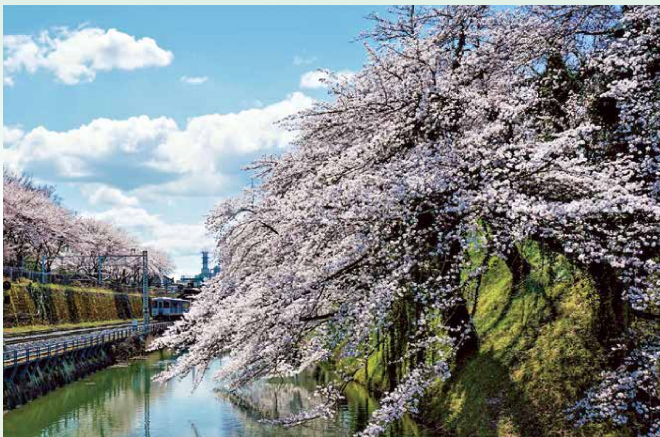
「お花見日和」霞城公園