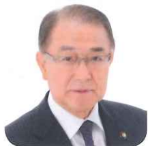
湯沢市長 鈴木 俊夫