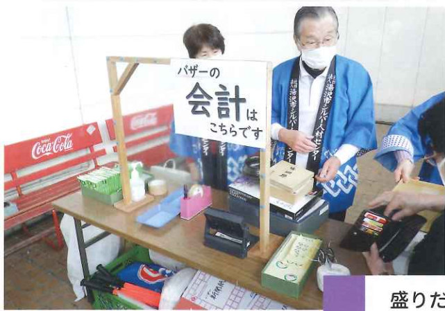
盛りだくさんのバザー