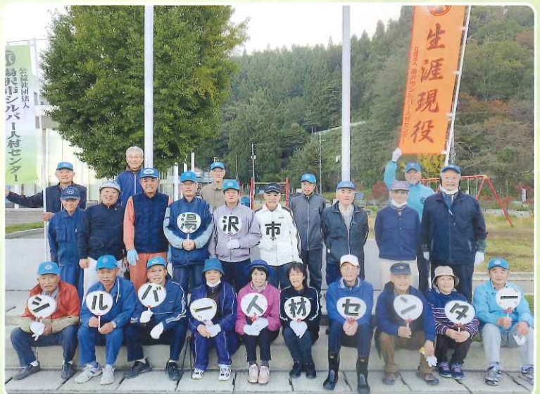
湯沢地区 10月21日 湯沢市街清掃