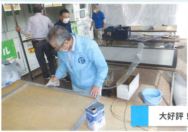
大好評！ 網戸張替え