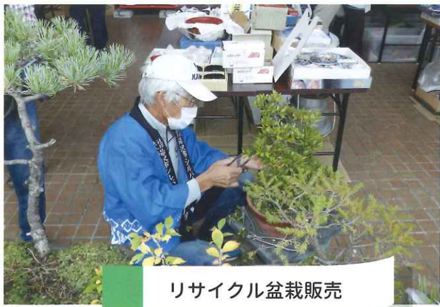
リサイクル盆栽販売