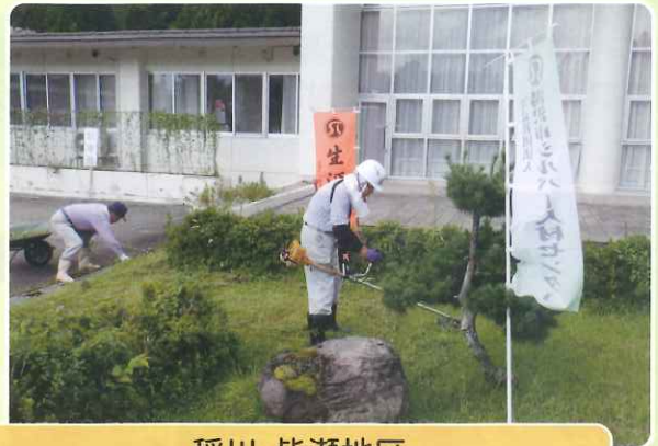
稲川・皆瀬地区 9月11日 『健寿苑』草刈り・清掃