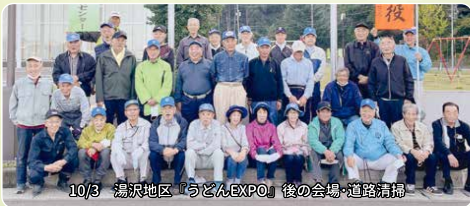
10/3 湯沢地区『うどんEXPO』後の会場・道路清掃