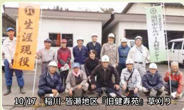
10/17 稲川・皆瀬地区『旧健寿苑』草刈り