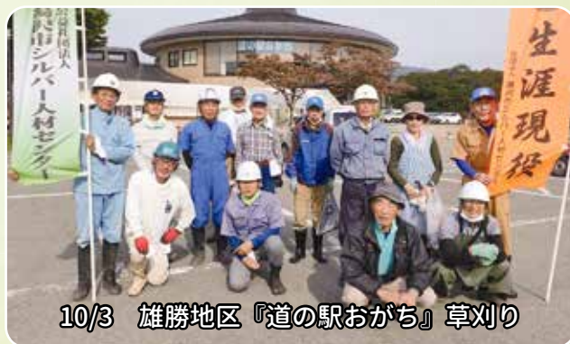
10/3 雄勝地区『道の駅おがち』草刈り