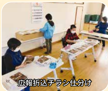
広報折込チラシ仕分け