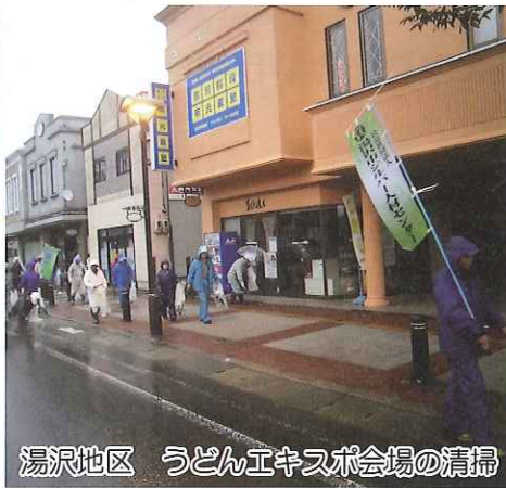
湯沢地区 うどんエキスポ会場の清掃