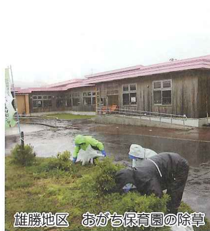
雄勝地区 おがち保育園の除草