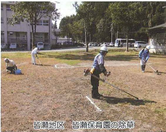
皆瀬地区 皆瀬保育園の除草