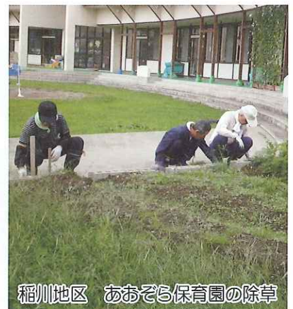
稲川地区 あおぞら保育園の除草