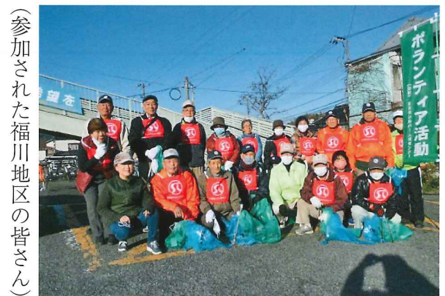
（参加された福川地区の皆さん）