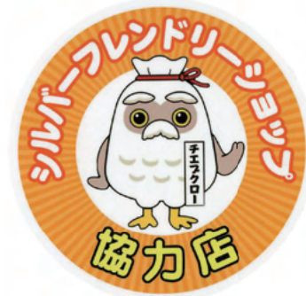
▲ 協力店ステッカー

ページでご確認ください。 また、会員の皆様のお知り合い等でのこの制度にご協力いただける店などがありますようお願いいたします。