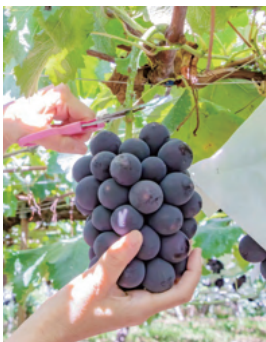
▲須金地区の紅葉とぶどう狩り

・鹿野地区ボランティア清掃・地区懇談会 11月15日(月) ※その他の地区の清掃・懇談会は未定