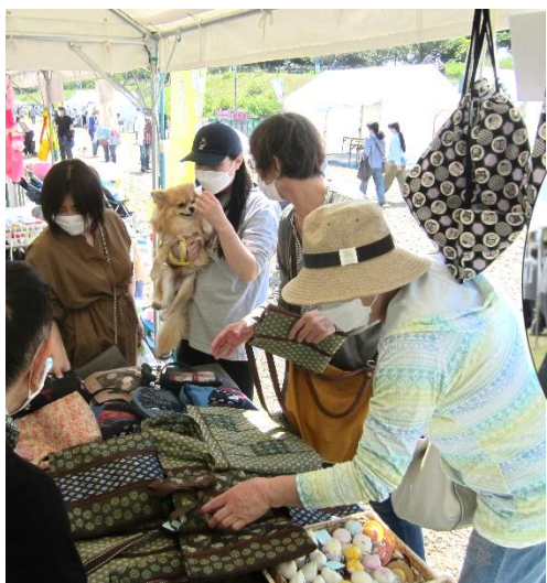
手作り小物の販売