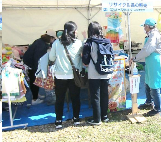
ベビー用品の販売