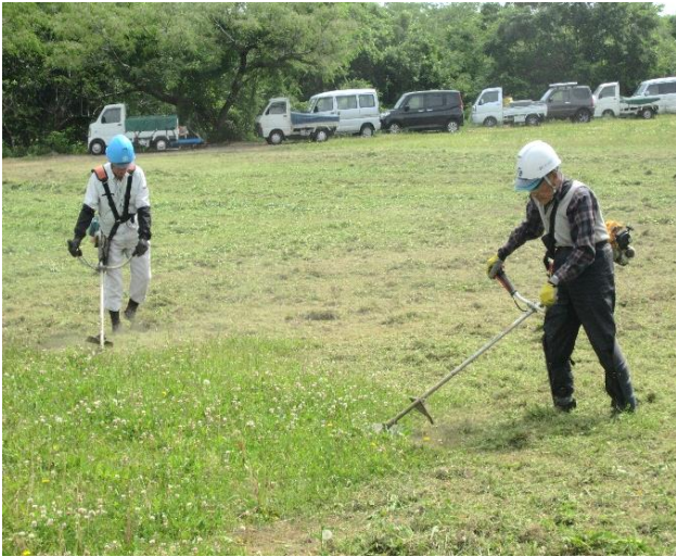
声を掛け合って活動しています。

多くの会員が前年度に引き続きの参加となり、久しぶりに顔を合わせた会員同士、笑顔で挨拶を交わされている様子は、草刈り班の結びつきの強さを感じました。