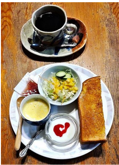
「珈琲茶屋秋桜」のモーニング