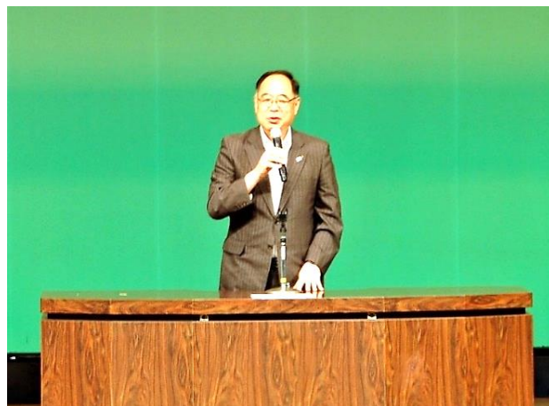
挨拶をされる福井副市長

今回提出された令和4年度事業報告、令和4年度収支決算、役員選任、役員報酬等の規程の改正、会費規定等の改正についての5議案については、出席者の過半数の決議により議決されました。また、令和4年度収支補正予算、令和5年度事業計画、令和5年度収支予算、第3次中期計画の策定についての4報告があり、令和5年度の定時総会は終了となりました。