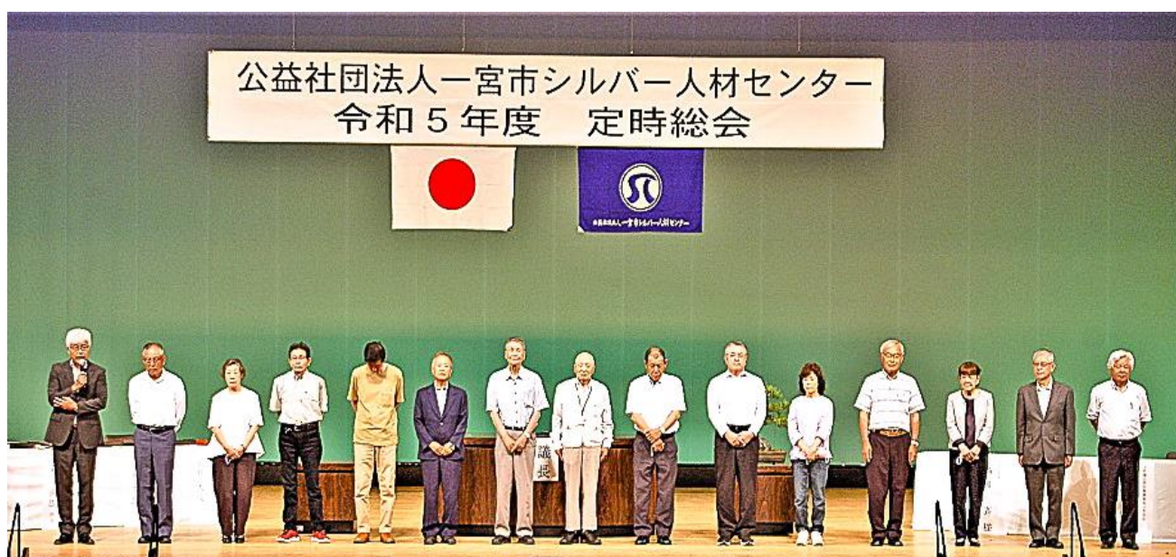
新役員 of 皆さん