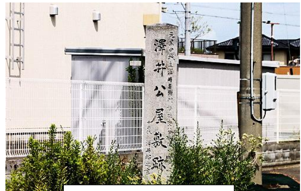
澤井公屋敷跡の石碑