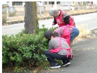
貴船ボランティアの様子

当センターは、仕事だけでなくボランティア等を通じて地域に密着した団体でありつづけたいと考えています。参加された会員の皆さん、大変お疲れ様でした。