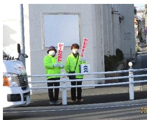
尾西ボランティアの様子