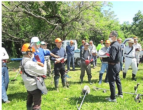
草刈り班研修会の様子

5月8日(水)に光明寺河川敷で草刈り班研修会及び草刈りボランティアを実施しました。