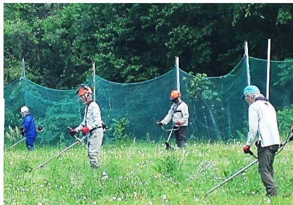
草刈り班ボランティアの様子

飛び石事故ゼロを心がけながら草刈り業務に取り組みましょう。参加された皆さん、お疲れさまでした。