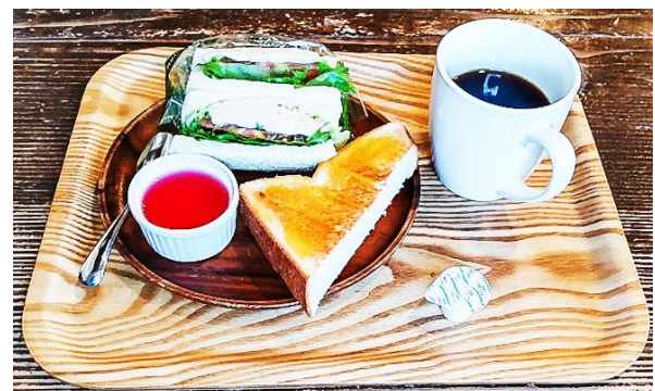
「3°C(サンドシー)」のモーニング

モーニングタイムは、午前9時から午前11時までで、定休日無し(1月1日～4日のみ休み)。