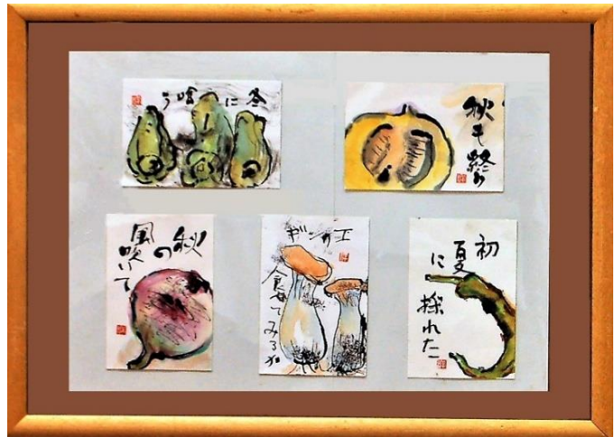
絵手紙 寺西 洋二