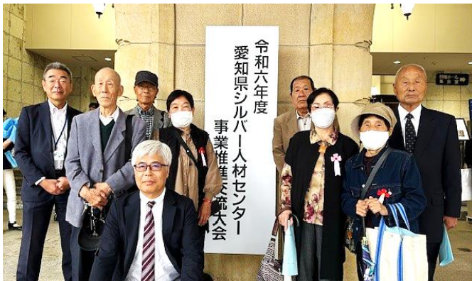
大会に参加された皆さん