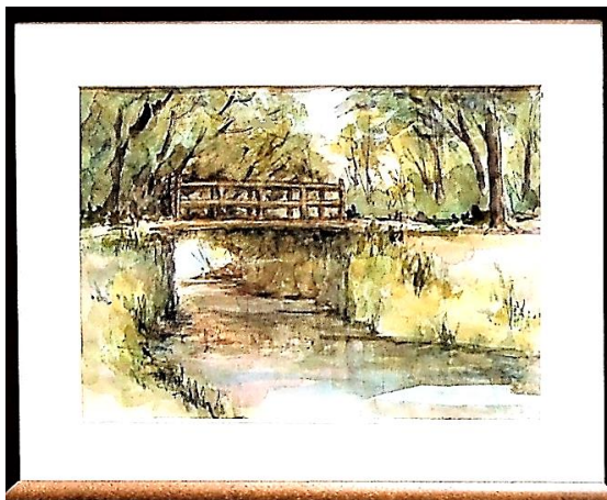
絵画「磯川緑地公園」野原三義