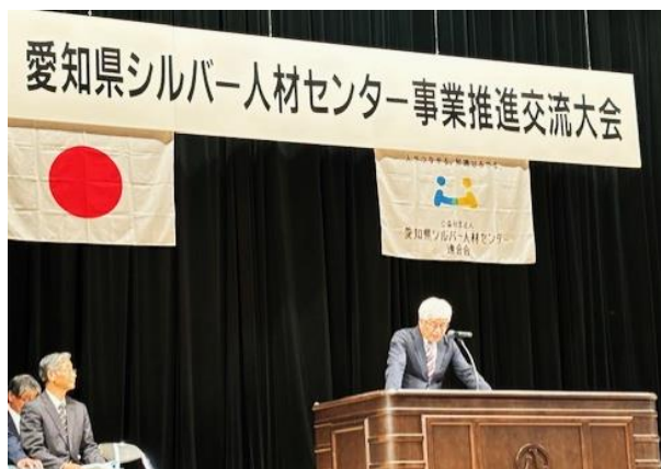
連合会前里会長による挨拶

なお、当センターの前里会長は愛知県シルバー人材センター連合会会長も兼任しており、今回の大会開催にあたり会長挨拶を行いました。