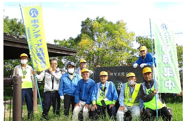
ボランティアに参加の皆さん