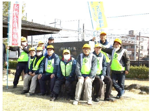
木曾川駐輪場整理班の皆さん