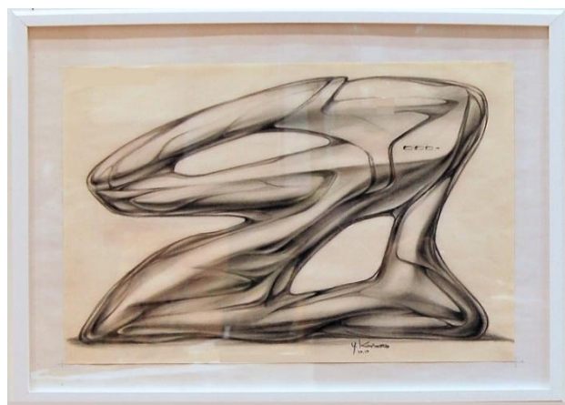
絵画「無題」栗本宜信