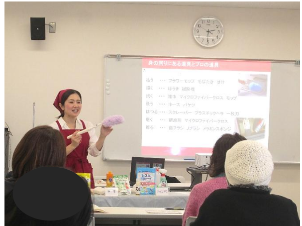
杉講師の明るく楽しい研修会の様子

情報が満載でした。今回の研修会に参加できなかった方、次回は是非参加してください。