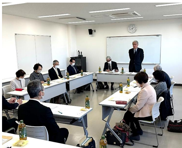
安城市SCとの意見交換の様子