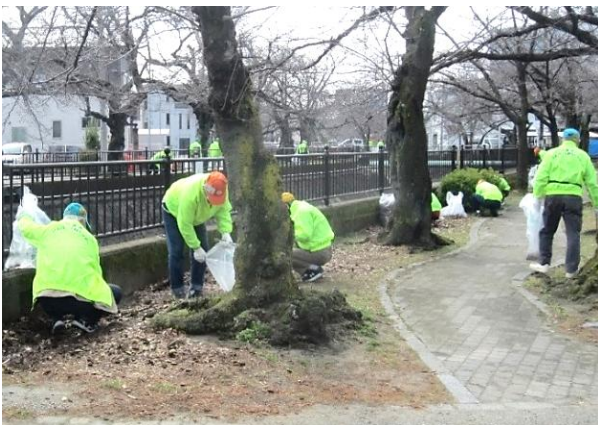
大江川清掃ボランティアの様子

46名の会員が午前9時30分に大乘公園に集合し大正橋から花祇橋の間でゴミや枯葉を拾いました。