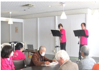
がマダム演奏の様子

就業面においても事故率の低い模範的な安全活動を行っており当センターにとっても学びの多い研修となり今後の事業運営に活かして参りたいと思います。