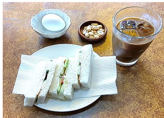
「キムラコーヒー店」のモーニング