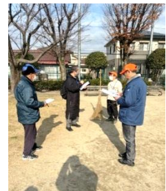
現場パトロールの様子