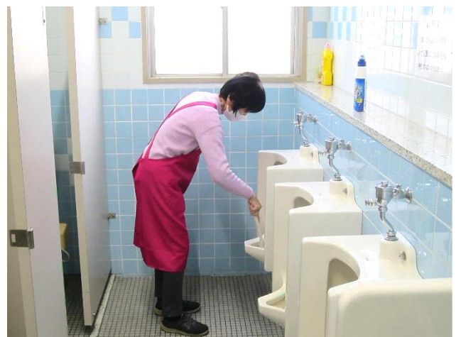
隅々まで清掃が行き届いていました