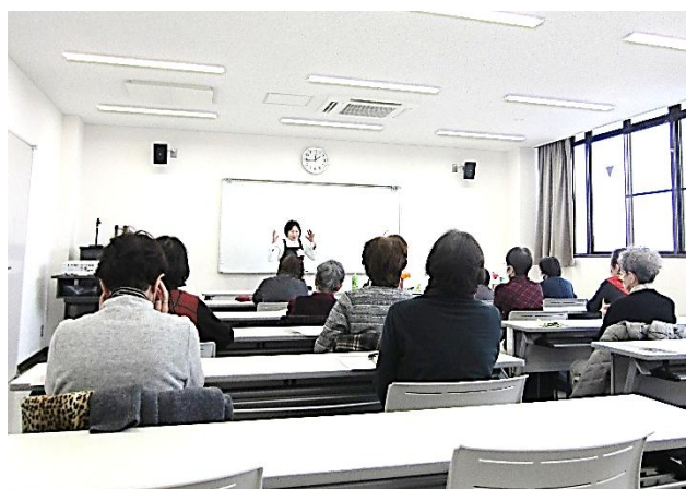
家事援助研修会の様子