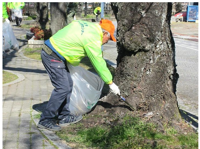
大江川清掃ボランティアの様子