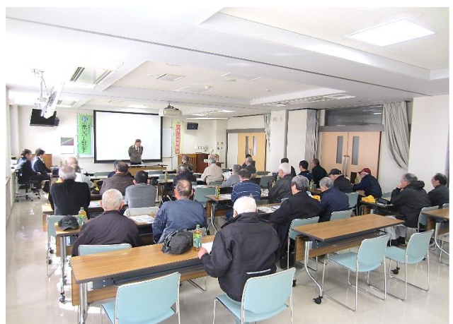
駐輪場班総会の様子