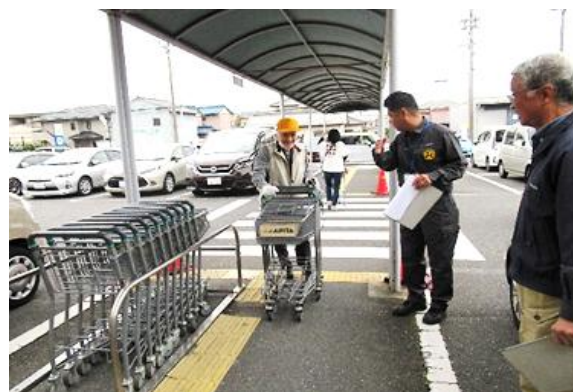
カート整理現場パトロールの様

これからも、一人一人が自覚を持ち、注意を忘れず、全国安全スローガンの「大丈夫 その慢心が 命取り」を意識し、常に事故の危険を忘れないように就業してください。