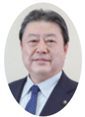
我孫子市長 星野 順一郎