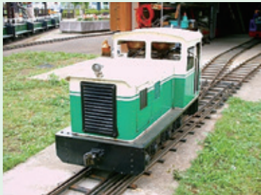
ディーゼル機関車