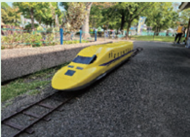
ドクターイエロー